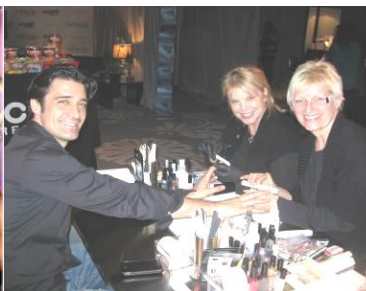
Golden Globes mit Gilles Marini "Sex and the City"