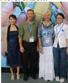
Arbeiten an Cosmoprof in China