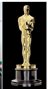
Vorbereitung 2011 Oscar-Hollywood