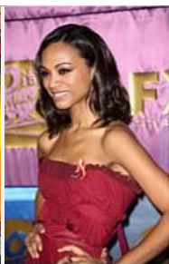
Golden Globes mit Zoë Saldana "Avatar"