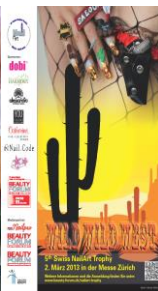
Titelbild Meisterschaft in Zürich