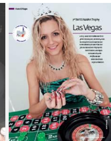
Swiss NailArt Trophy Las Vegas